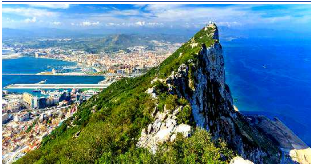
Particolare della Rocca di Gibilterra

Prima colazione in hotel e partenza per Cordova . Visita guidata della città dove si potrà ammirare la Mezquita-Catedral , antica Moschea Araba , una delle più belle opere d'arte islamiche in Spagna, trasformata in bellissima Cattedrale ; passeggiata per l'antico quartiere ebraico della Juderia con le sue viuzze caratteristiche e la Sinagoga ; le case con i balconi colmi di fiori ed i tradizionali cortili andalusi. Proseguimento per Siviglia con sosta a Carmona , importante crocevia ai tempi dei romani, che possiede oggi un bellissimo centro storico monumentale, muraglie ed archi arabi, una necropoli romana ed un Alcazar (castello) oggi diventato Parador . Arrivo in hotel, sistemazione nelle camere riservate, cena e pernottamento.