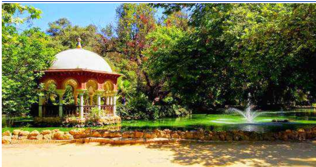
Particolare Parco di Maria Luisa

Prima colazione in hotel. In base all' operativo del volo, trasferimento con pullman in aeroporto, disbrigo delle formalità d'imbarco e partenza con volo per Roma Fiumicino .