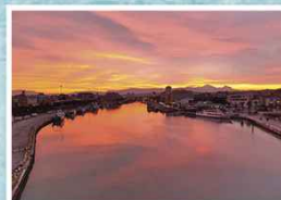
5° Premio - Salvatore Gerboni