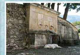
6° Premio - Livio Falcone