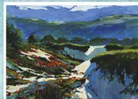
2° Premio - Saverio Di Donato ex aequo