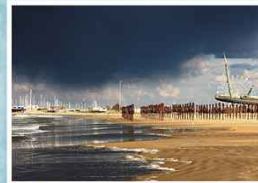
1° Premio - Massimiliano Febbo