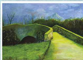
2° Premio - Anna Bellisi ex aequo